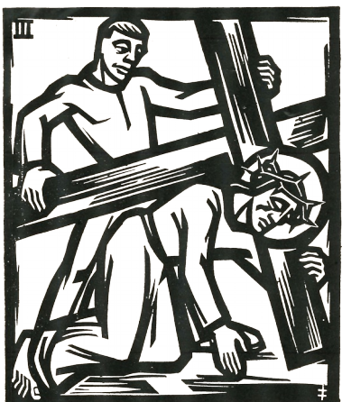
3. Station: Jesus fällt zum ersten Mal unter dem Kreuz.