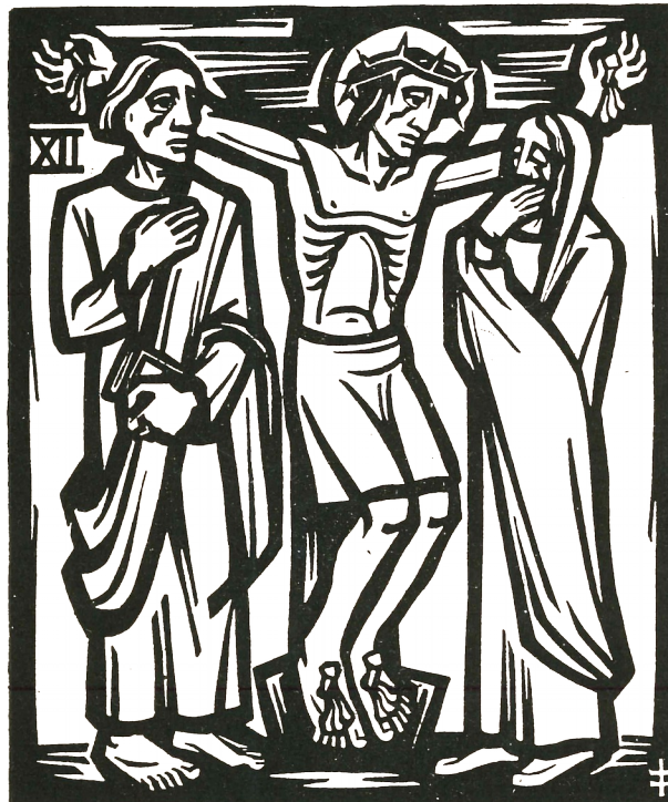
12. Station: Jesus stirbt am Kreuz.