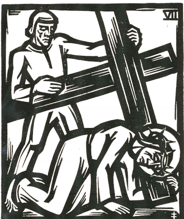
7. Station: Jesus fällt zum zweiten Mal unter dem Kreuz.

Auch wenn ich mich wieder aufgerafft habe – es kann sein, dass ich neuerlich falle. Es mag mich trösten: Jesus erging es nicht anders.