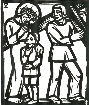
5. Station: Simon hilft Jesus das Kreuz tragen.

Manche Situation und manche Last sind allein nicht zu bewältigen. Und es tut wohl zu wissen, dass ich damit nicht alleingelassen bin. Neben dem Mittragen geht es ums Mit-gehen.