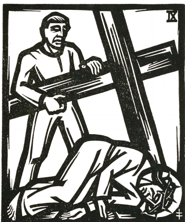
9. Station: Jesus fällt zum dritten Mal unter dem Kreuz.

Jetzt scheint die Last endgültig zu schwer. Die Kraft ist am Ende. Es geht auf die allerletzten Reserven.