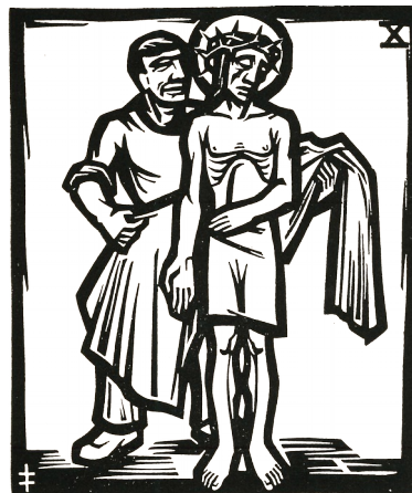
10. Station: Jesus wird seiner Kleider beraubt.