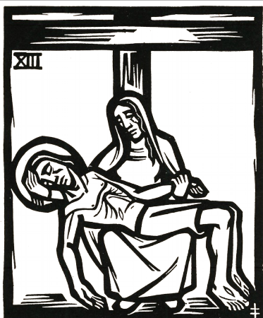
13. Station: Jesus wird vom Kreuz genommen und in den Schoß seiner Mutter gelegt.

Das grausame Spiel hat ein Ende. Noch einmal der Mutterschoß, diesmal mit dem toten Sohn. Für Jesus ist es vorbei – für die Mutter nicht.