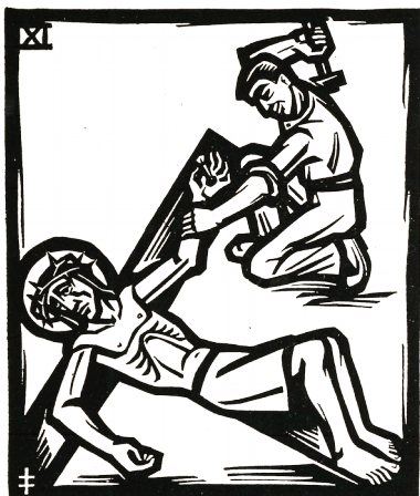
11. Station: Jesus wird ans Kreuz geschlagen.

Oft wollen wir andere festhalten. Sie festnageln auf ihre Überzeugungen oder unsere Vorurteile. Jesus hat sich festgelegt.