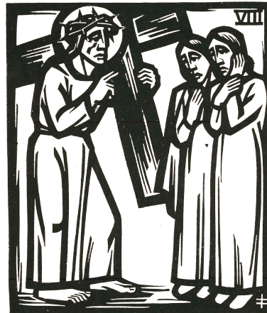
8. Station: Jesus begegnet den weinenden Frauen.