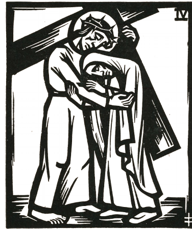
4. Station: Jesus begegnet seiner Mutter.