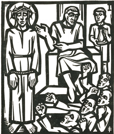
1. Station: Jesus wird zum Tod verurteilt.

Im Namen des Vaters und des Sohnes und des Hl. Geistes. Amen!