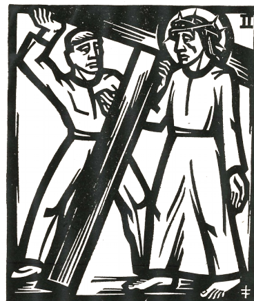
2. Station: Jesus nimmt das Kreuz auf sich.

Hin und wieder drückt uns etwas nieder. Wir geraten außer Tritt und stolpern. Manchmal fallen wir auch hin.