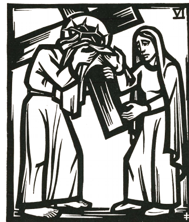
6. Station: Veronika reicht Jesus das Schweißtuch.

Eine hilfreiche Frau am Straßenrand. Sie will in einer hilflosen Geste eine Erleichterung schaffen. Dabei wandelt sich das Antlitz des Leidenden zum bleibend eingepägten Schatz.